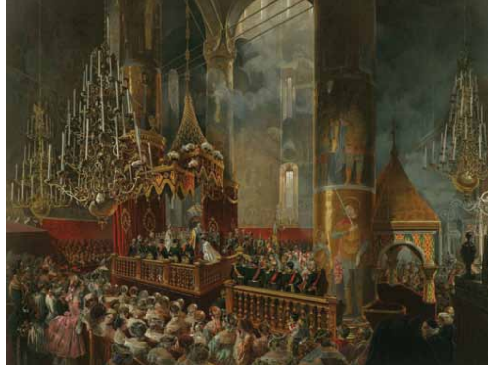
Die Krönung der Kaiserin, Mihály von Zichy, Chromolithographie, 1856

Das Titelblatt zum 3. Kapitel ist ein Meisterwerk von Ippolit Monighetti: Eine sehr detailreiche dekorative Komposition stellt der Anfangsbuchstabe und die Umrahmung mit den Ansichten des Palastes, der Kirche und des Parks in Ostankino in der Nähe von Moskau dar. Das Blatt ist ein hervorragendes Beispiel der Druck- und Buchkunst sowie der Technologie und der Druckgraphik des 19. Jahrhunderts. Graf Ščeremet'ev ließ das Palais noch für die Krönung von Paul I. bauen, für dessen einsame Vorbereitung zur Krönung im Fasten und Gebet. Der Sohn des Grafen fühlte