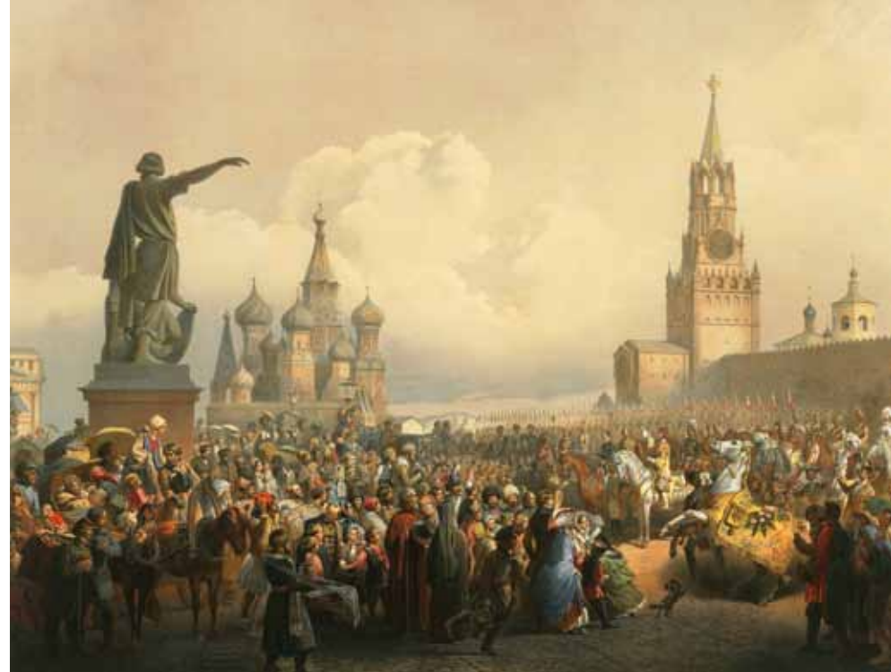
Die Verkündung des Krönungstages auf dem Roten Platz, Georg Wilhelm Timm, Chromolithographie, 1856

Anders als in diesem Eingangsholzschnitt zum 2. Kapitel entfaltet Mihály (von) Zichy das gleiche Thema in der farbigen Chromolithographie. Hier schaut der Künstler auf die feierliche Prozession des Kaiserpaars aus der Menge des jubelnden Volkes. Die Prozession passierte gerade das Triumphtor von der Seite der Stadt Twer. Das Triumphtor im römischen Stil wurde auf Anregung von Zar Nikolaus I. vom Architekt Osip Bowe 1834 erbaut. Dieses Motiv wurde nicht zufällig gewählt, denn das Tor sollte an die Siege von 1812 – 1814 über die napoleonischen Armeen erinnern. Die Inschrift auf der Attika lautete „Zur Erinnerung an die Taten Kaiser Alexanders I. 1812“.