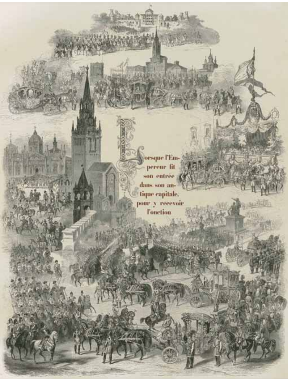
Der Anfangsbuchstabe und die Umrahmung mit Szenen des Kaiserlichen Festzuges, Seite 19 in der Deskription, Mihály von Zichy, Holzstich, 1856

Es darf nicht außer Acht gelassen werden, dass die meisten der anwesenden ausländischen Gäste bei der Zarenkrönung die derzeitigen Sieger über das Russische Reich darstellten. Den Siegermächten gegenüber stellte sich das unterlegene Reich mit der kunstvollen Inszenierung der Zarenkrönung und mit der entsprechenden anschaulichen visuellen Beweise im Krönungsbuch als eine tolerante, multinationale und multireligiöse, politisch-kulturelle Macht dar. 7 Tatsächlich birgt die vorliegende einmalige Quelle im Text und im Bild direkte und bedeckte Anspielungen einer solchen Botschaft, die für uns heute als die zukunftsweisende Elemente deutlich werden. Unter Alexander II. wurden bald sichtbare Erfolge auf dem internationalen Parkett sowie auf dem Balkan, aber auch im Kaukasus erzielt. Der Thronfolger Alexander Nikolaevič fasste lange vor seiner Krönung unter dem Einfluss der besten Köpfe Russlands, den Entschluss innere Reformen und einen entschlossenen außenpolitischen Kurs durchzuführen.