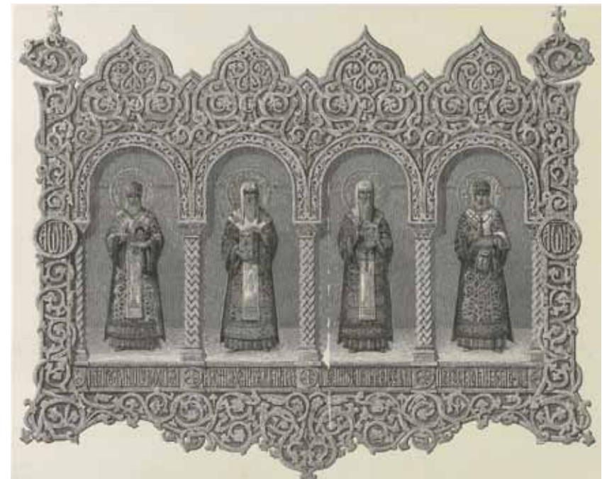
Die Schlussvignette mit der Darstellung der Moskauer Metropolitän Petr, Aleksi, Ion und Filipp Ippolit Antonovič Monighetti, Holzstich, 1856

Professor Hermann Goltz, betonte bei der kunsthistorischen Betrachtung dieser Quelle: „Das Krönungsbuch regt folglich zu einer vertieften Erkenntnis einer gemeinsamen europäischen Kunstgeschichte an, begünstigt