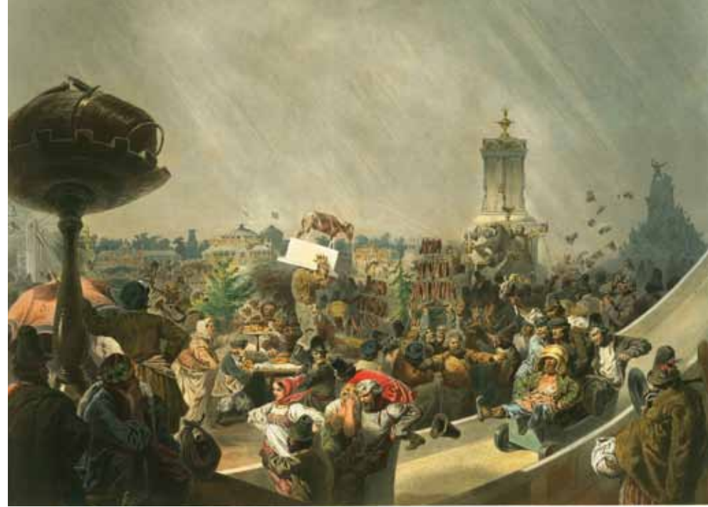
Das Volksfest auf dem Chodynskoe Pole, Mihály von Zichy, Chromolithographie, 1856

Die Chromolithographien von Zichy und Timm geben ein prächtiges Bild vom Inneren der Kathedrale. Die ungewöhnliche Weitläufigkeit begeistert trotz der großen Menge der Anwesenden. Eine besondere feierliche Liturgie schloss die Krönung in sich. Der Kaiser nahm aber die Herrscherwürde nicht aus den Händen des Metropoliten, sondern krönte sich selbst. Diese Form der Selbstkrönung führte Peter der Große ein, als Symbol des absoluten Monarchen, der weder einer weltlichen noch einer kirchlichen Macht untersteht, sondern direkt von Gott gekrönt wird. Dadurch, dass der Kaiser sich fortan selbst mit der kaiserlichen Würde ausstattete und nicht mehr durch den Metropoliten oder Patriarchen, veränderte sich auch die Rolle der Kirche bei der Krönung. Mit der Selbstkrönung der Monarchen war der Wandel vom Zarentum zum Kaisertum in Russland abgeschlossen. Die Kirche und das Volk beteten aber für den Kaiser und seine Familie. Das Gebet für Kaiser war seit Byzanz, ein festen Bestand einer jeden Liturgie. Diese Tradition symbolisiert das Gebet des Metropoliten, das in der Illustration von Georg Wilhelm Timm wiedergegeben ist. Während der Liturgie hat der Kaiser keine Krone auf dem Kopf. Er setzte sie erst am Ende des Gottesdienstes wieder auf sein Haupt. Nach dem die Evangeliumspassagen vorgelesen wurden, küsste der Kaiser das Evangelium. Erst nach dem im Altarraum die Priester das Abendmahl empfangen hatten und die Gläubigen in der Kirche im Gebet dem Psalmengesang