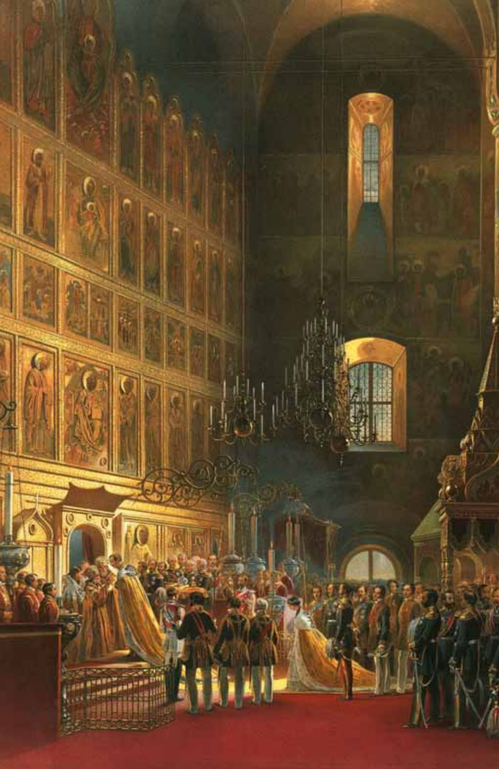
Die Salbung des Kaisers, Georg Wilhelm Timm, Chromolithographie, 1856